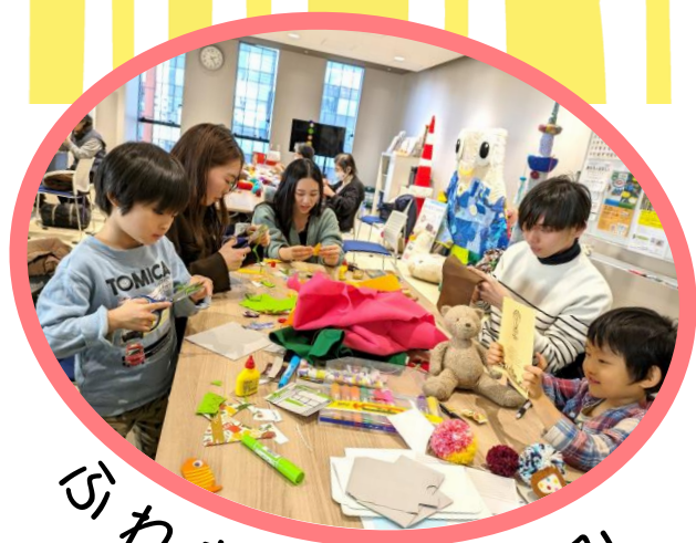
ふれあい・楽しみ

ボランティアが運営する「ふれあいサロン」やボランティアと社協職員が運営する「はあとサロン」「みんなのサロン」の情報を毎月お届け！