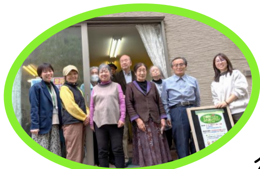
みんなでつくろう