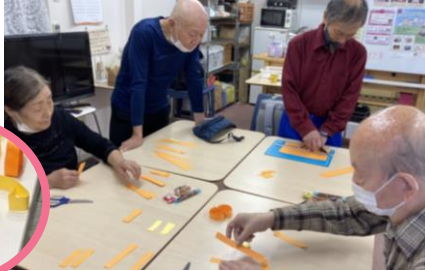
完成したカボチャはこちら↓

普段のフリータイムでは塗り絵をしたりゲームをしたりしています。この日は他のイベントで使うカボチャの飾りなどを皆さんと作りました。カットする人、ホチキスで止める人など手分けして、あっという間にたくさん飾りが出来上がりました。